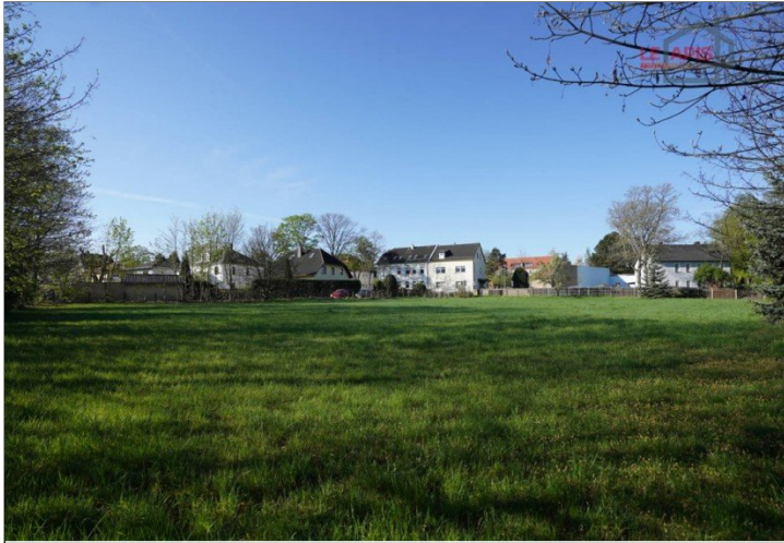
Grundstück Bild 2