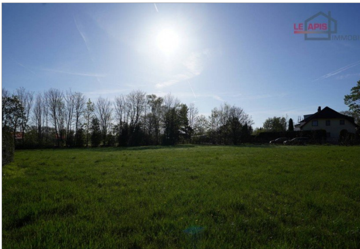
Grundstück Bild 3