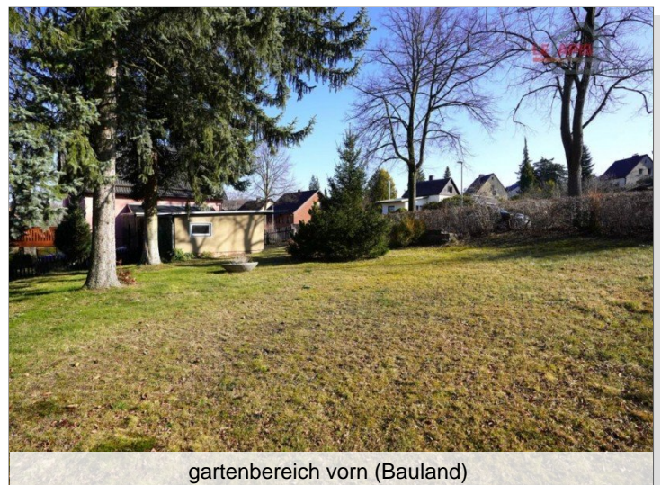
gartenbereich vorn (Bauland)