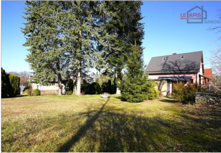
Gartenbereich vorn (Bauland) Bild 2)