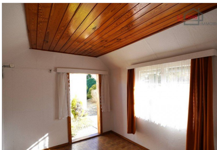
Abstellraum Innenbereich Bild 2