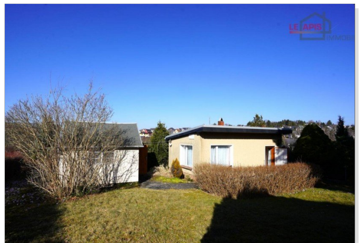
Bungalow u. Abstellraum hinterer Gartenbereich