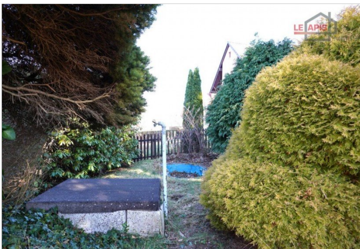
Gartenbereich Seite rechts