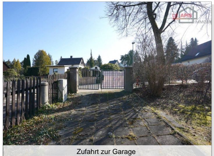
Zufahrt zur Garage