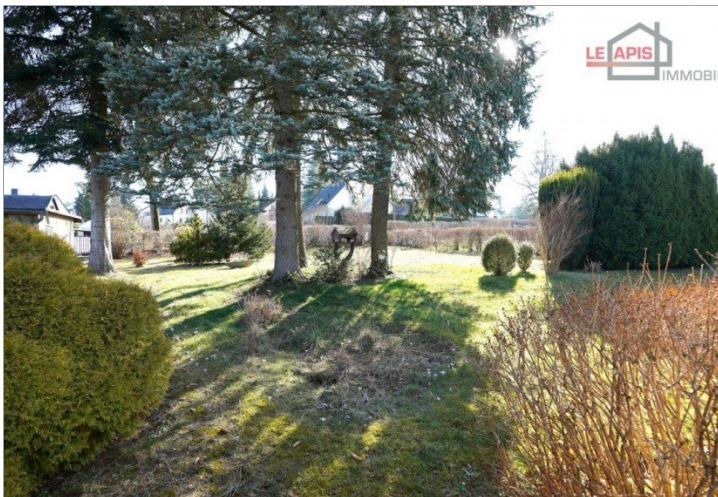
Gartenbereich Blick vom hinteren Gartenbereich