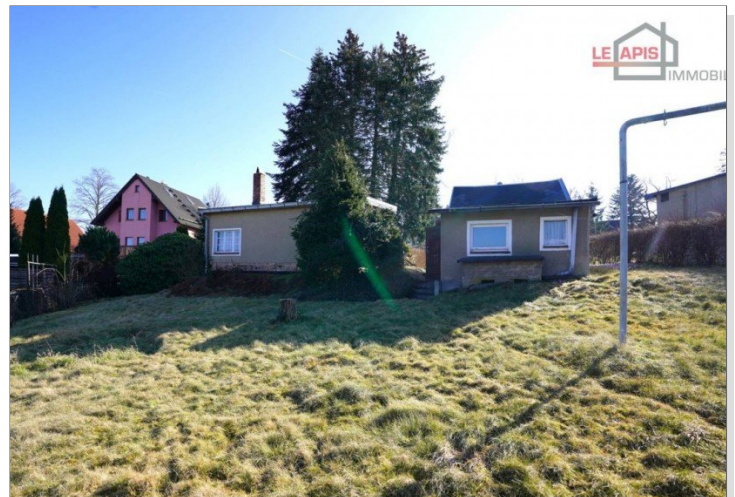
Gartenbereich hinten Bild 2