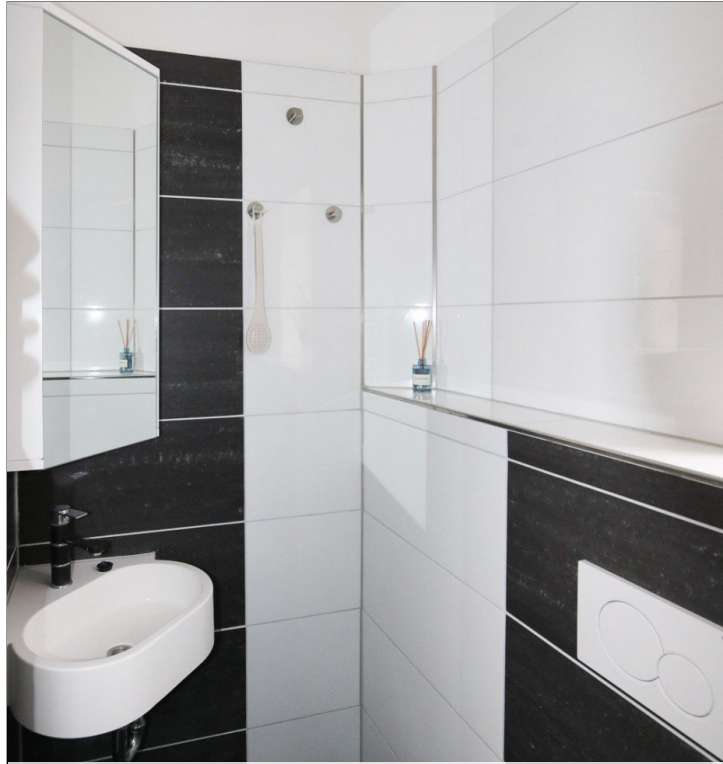
1.OG Bad mit Wellness-Dusche