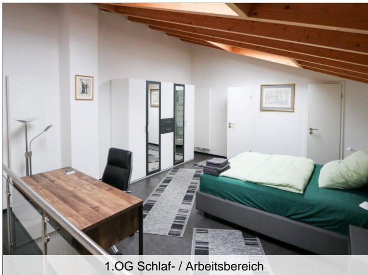
1.OG Schlaf- / Arbeitsbereich