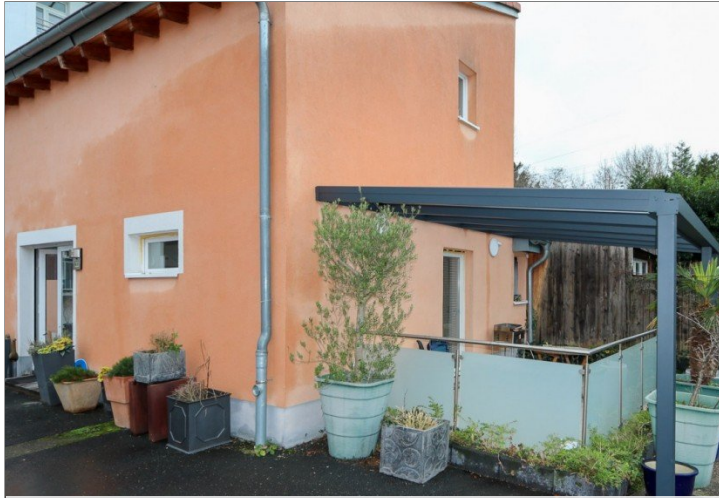
Seitenansicht mit überdachter Terrasse